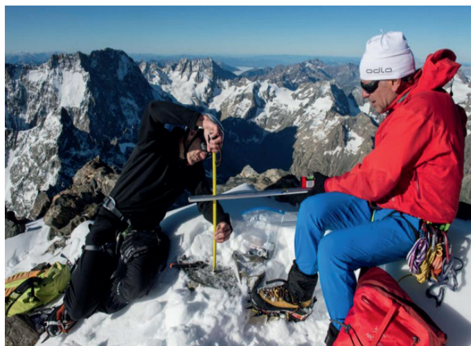
Dôme de Neige des Écrins

L'objectif de l'expédition, à l'initiative du syndicat des géomètres experts ainsi que de l'ordre des géomètres experts de la région PACA, était de mesurer précisément, au centimètre près, l'altitude de la Barre des Écrins. Ce projet s'inscrivait dans la continuité des célébrations du 150 e an-