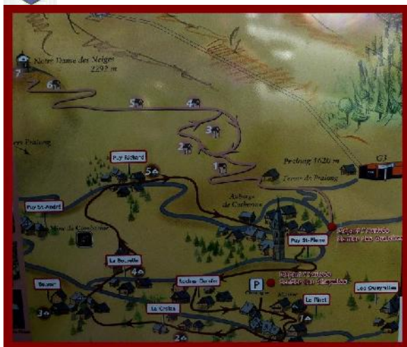
Le sentier des oratoires