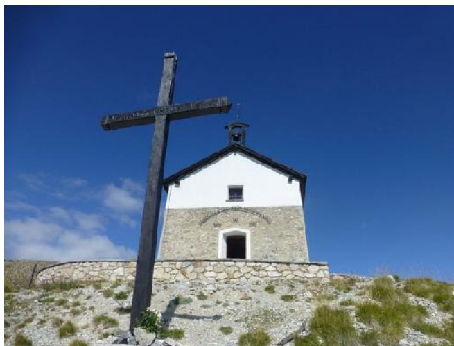
Notre Dames des Neiges

Cet appel à candidature s'inscrit dans le cadre de la procédure de délégation de service public (DSP). L'objectif est ici de permettre aux candidats de mieux appréhender :