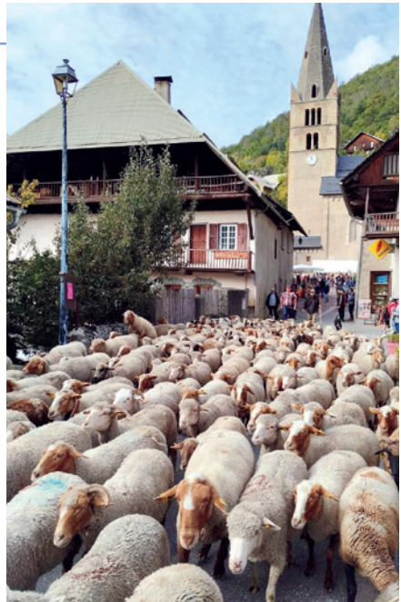
Foire d'automne, 22 octobre 2023

Si vous avez du temps à offrir, envie de partager, de vous faire plaisir et